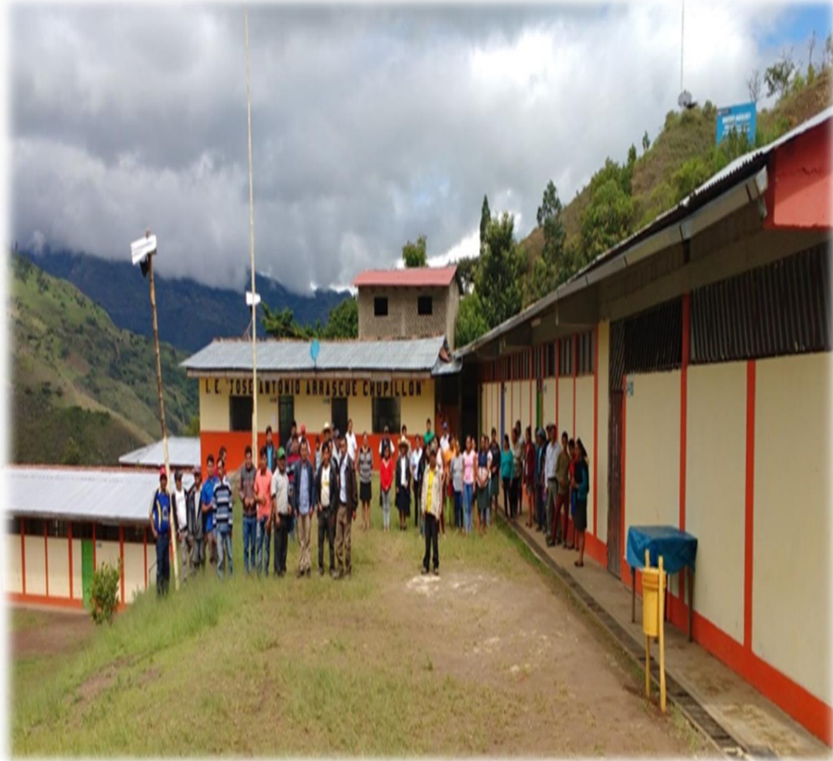
EDUCATIVA SECUNDARIA (JOSÉ ANTONIO ARRASCUE CHUPILLÓN