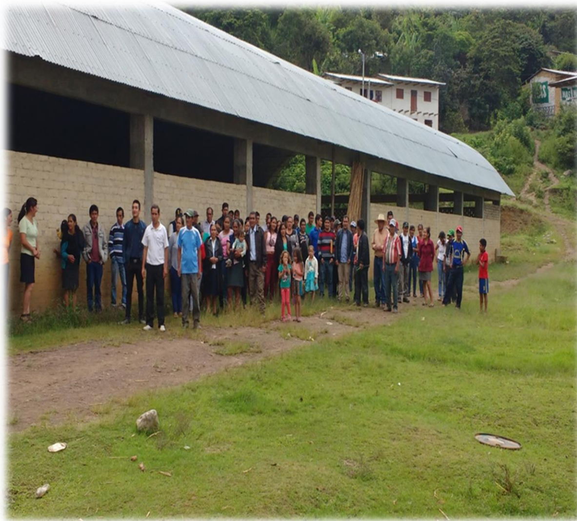
MERCADO DE ABASTOS