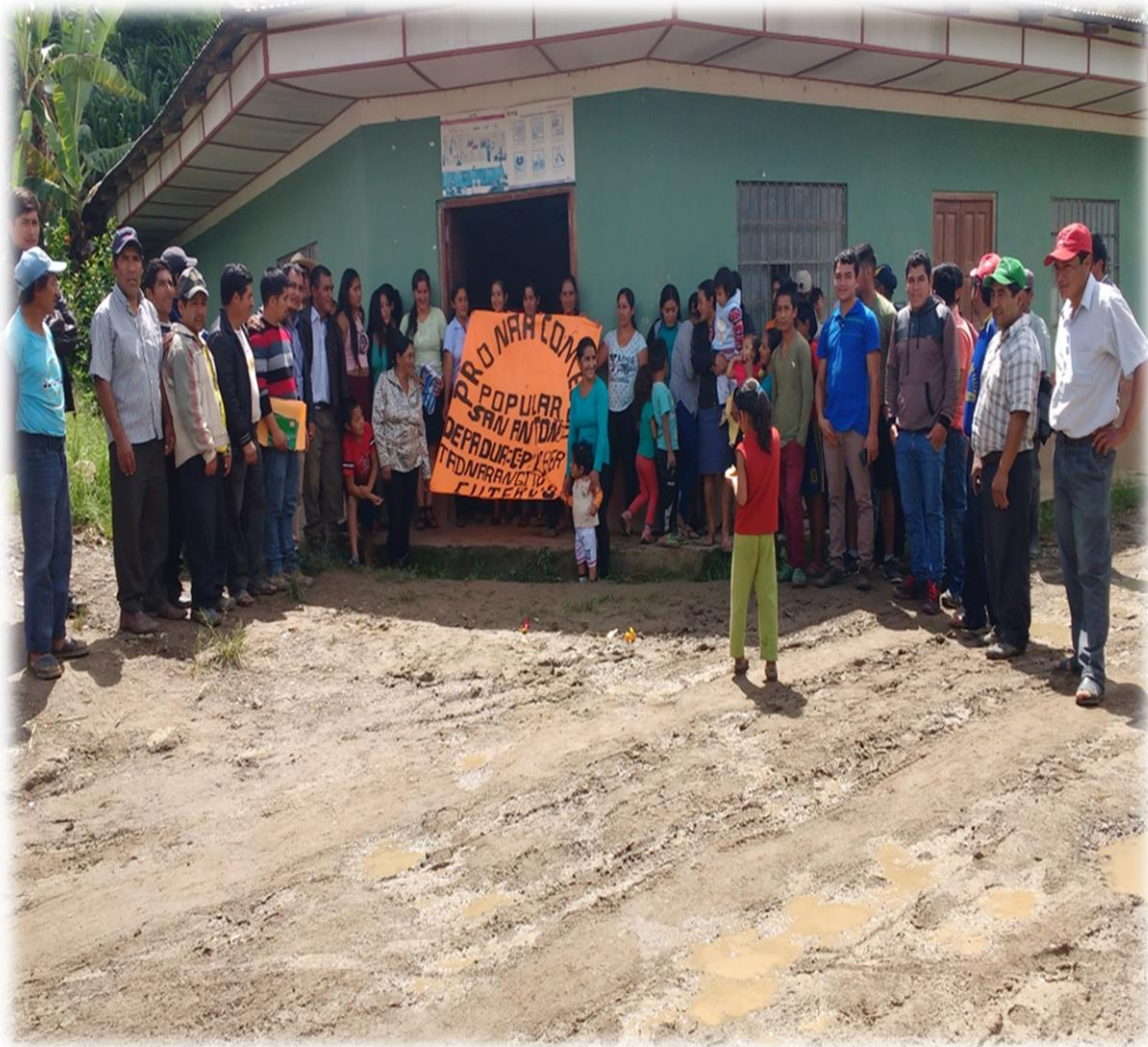
PRONA - COMEDOR POPULAR EN EL CENTRO POBLADO "LIBERTAD NARANJITO DE CAMSE".