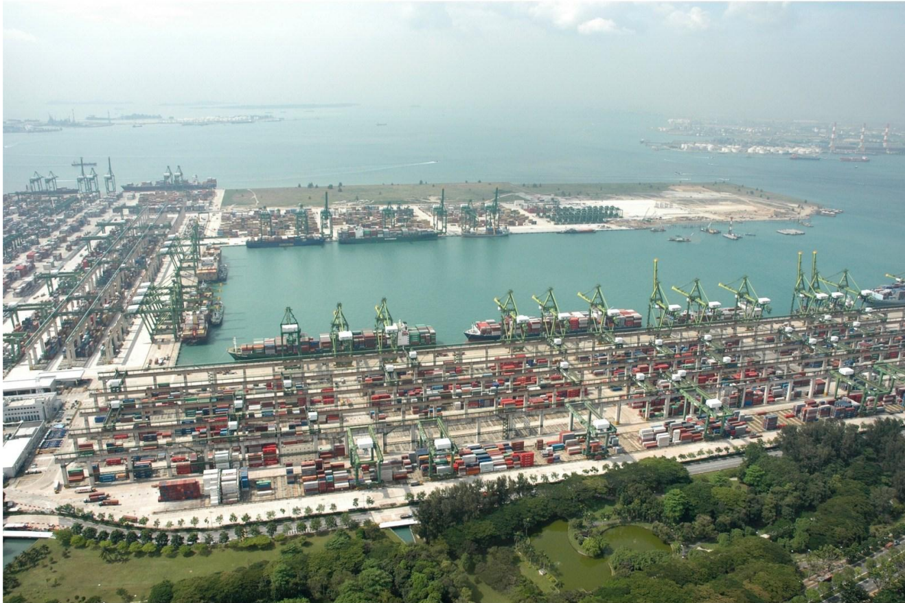
PASIR PANJANG TERMINAL, PSA SINGAPORE TERMINALS