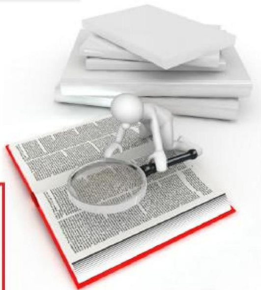
Congresista Miguel Torres Morales

Y el otro bastante más parecido, es el modelo chileno, en donde básicamente puede solicitarse el aplazamiento hasta por dos meses, todos los meses, todos los periodos del año puedo solicitar hasta dos meses el aplazamiento del IGV.