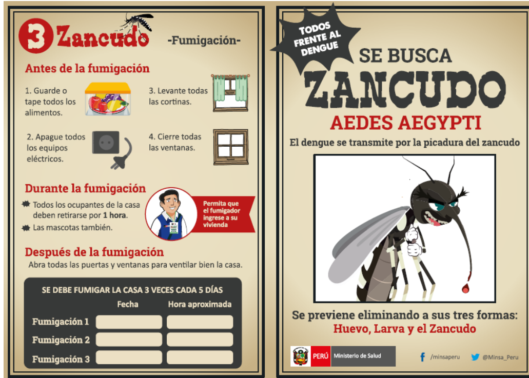
Materiales de información y prevención