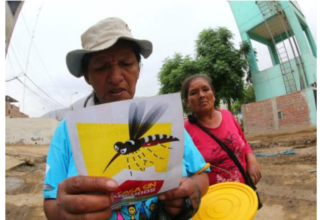
Campañas de información